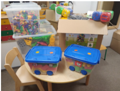
Rysunek 3. Zestaw klocków i układanek.