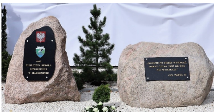
Rysunek 3. Instalacja kamieni i tablic upamiętniających 100- lecie Publicznej Szkoły Powszechnej w Marzeninie.