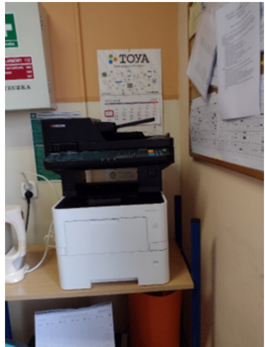
Rysunek 2. Urządzenie wielofunkcyjne.