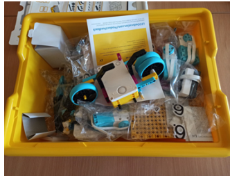
Rysunek 2. Zestaw Klocków „LEGO SPIKE” – nauka programowania.