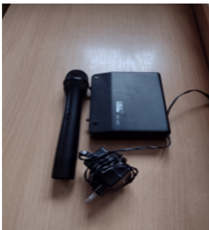
Rysunek 3. Mikrofon bezprzewodowy.