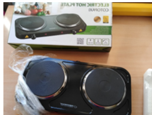
Rysunek 4. Kuchenka do podgrzewania posiłków.

Przedszkole posiada gabinet logopedy, wyposażony w pomoce dydaktyczne do prowadzenia zajęć logopedycznych. Gabinet służy również do prowadzenia zajęć rozwijających kompetencje emocjonalno – społeczne z Pomocy Psychologiczno - Pedagogicznej - terapia z arteterapią. Wszyscy nauczyciele w roku szkolnym 2021/2022 mieli dostęp do komputerów oraz Internetu. Do celów dydaktycznych na wyposażeniu przedszkola na koniec roku szkolnego 2021/2022 znajdowały się: 3 laptopy, 2 komputery, 3 drukarki, 2 telewizory, 2 odtwarzacze, 1 DVD, 3 radiomagnetofony, 3 przenośne głośniki, 2 tablice interaktywne, 1 magiczny dywan, 1 mikrofon.