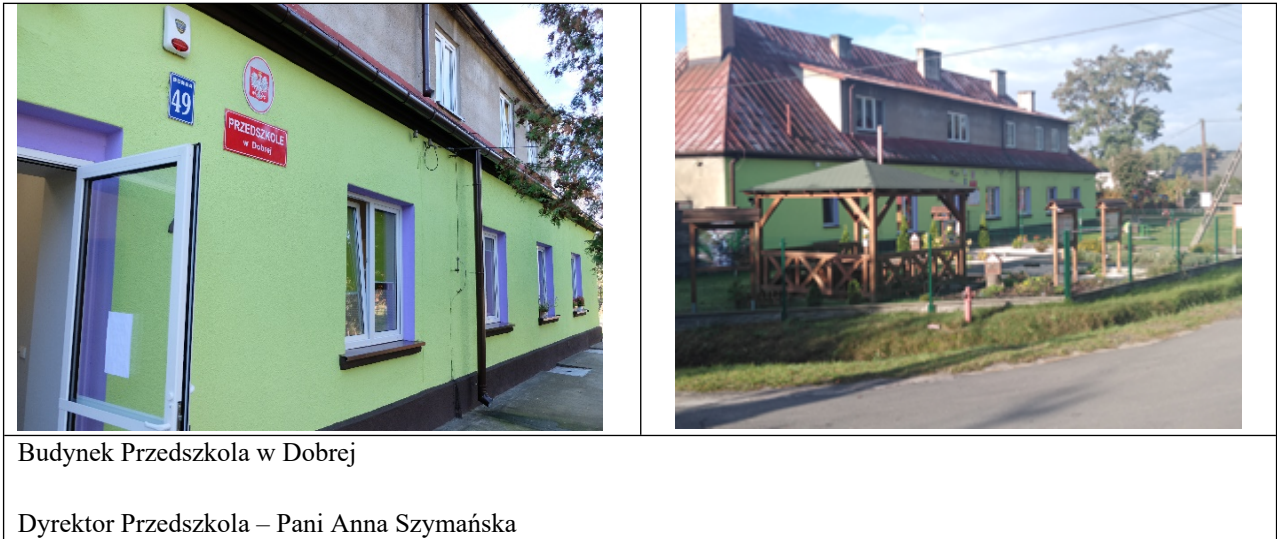
Budynek Przedszkola w Dobrej