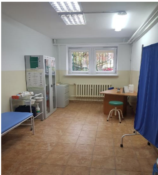
Rysunek 3. Gabinet pielęgniarki.