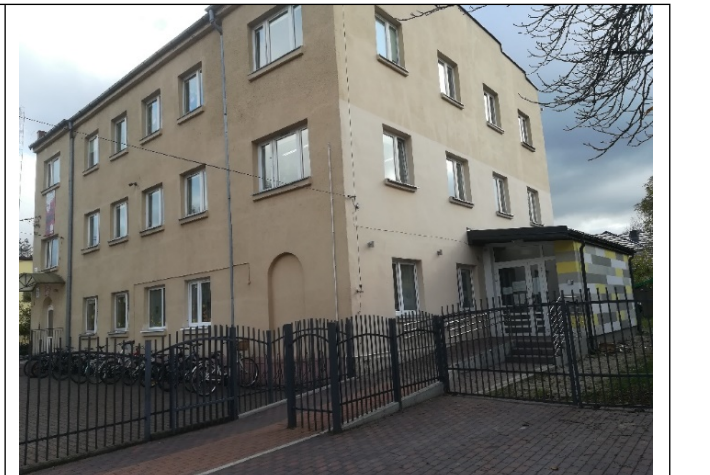
Budynek Zespołu Szkół w Marzeninie