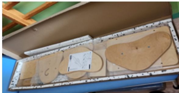
Rysunek 4. Kładka równoważna.