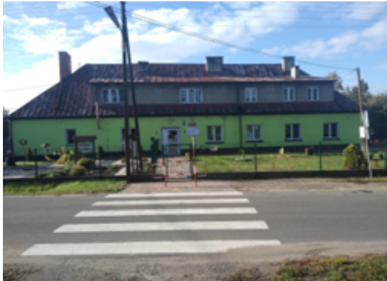
Rysunek 1. Nowe ogrodzenie przedszkola.