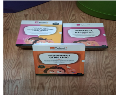
Rysunek 1. Podręczniki do diagnozy, profilaktyki oraz terapii.

W roku szkolnym 2021/2022 w Zespole szkół w Marzeninie w okresie od 1 września 2021 roku do 31 sierpnia 2022 roku w ramach stosowania specjalnej organizacji nauki i metod pracy dla dzieci i młodzieży objętych kształceniem specjalnym, zakupiono niezbędne pomoce naukowe na łączną kwotę 36 523,91 zł.