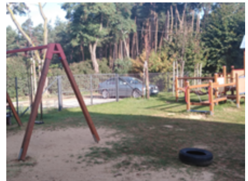
Rysunek 4. Zasadzone drzewa na terenie.