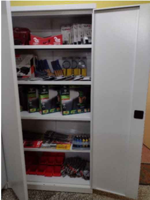
Rysunek 1. Zestawy narzędzi do pracowni technicznej – „Laboratoria przyszłości”.

Ponadto nieodpłatnie szkoła otrzymała 12 zestawów komputerowych przekazanych przez Bibliotekę Publiczną w Sędziejowicach oraz 2 baseny z kulkami do zabaw dla dzieci z przedszkola przekazane przez Przedszkole w Dobrej.