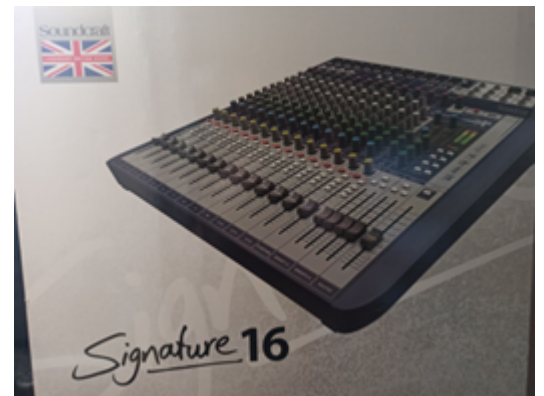
Rysunek 3. Mikser dźwięku – „Signature 16”.