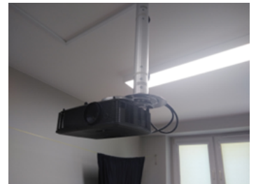
Rysunek 2. Projektor do sali zajęć.