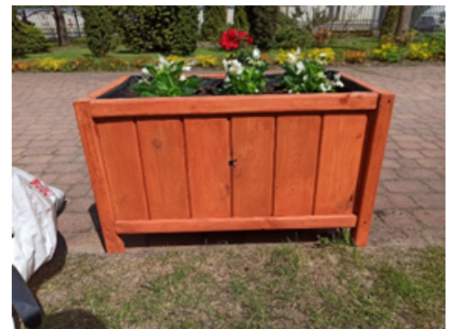
Rysunek 4. Montaż donic z kwiatami na terenie dziedzińca szkolnego.