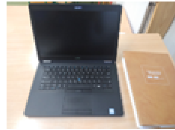
Rysunek 1. Laptop do Sali zajęć.