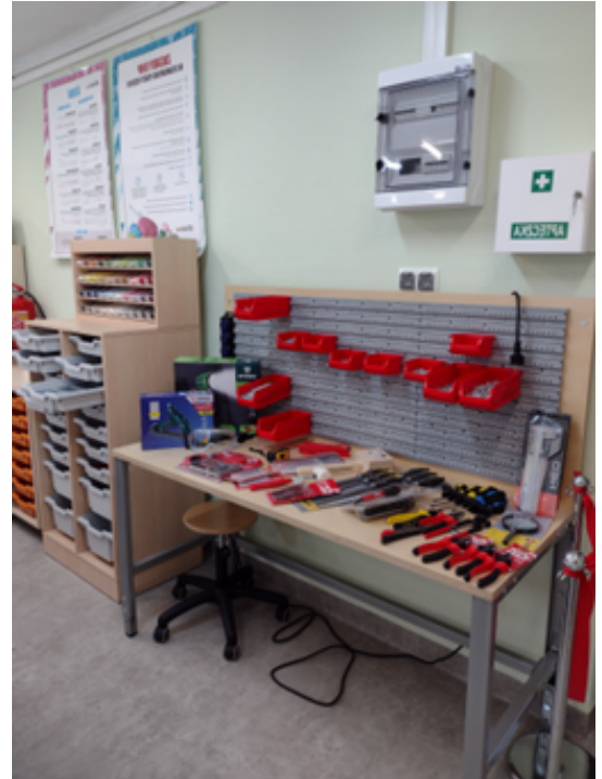
Rysunek 2. Pracownia techniczna – „Laboratoria przyszłości”.