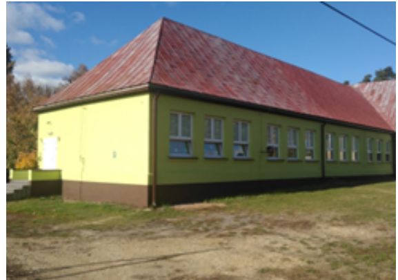
Rysunek 2. Pomalowane 2 ściany budynku przedszkola od strony boiska.