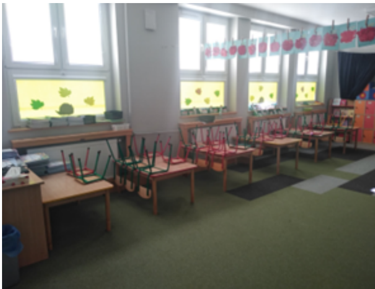
Rysunek 3. Nowe grzejniki w sali zajęć.