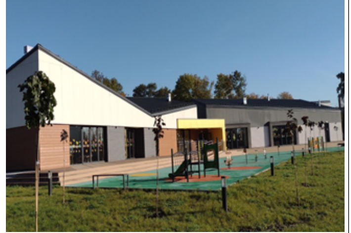
Budynek Zespołu Szkół Ogólnokształcących Nr 1 im. Powstańców 1863 r. w Sędziejowicach