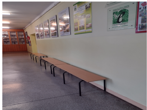
Rysunek 4. Ławki korytarzowe.