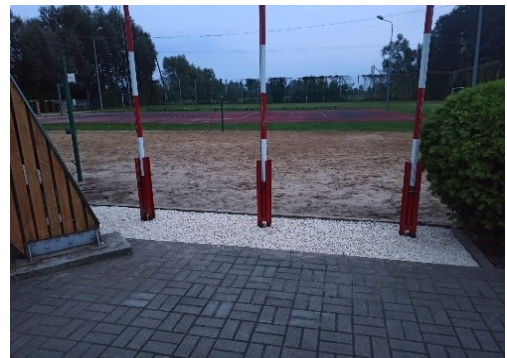
Rysunek 2. Maszty flagowe, wysypanie grysem.