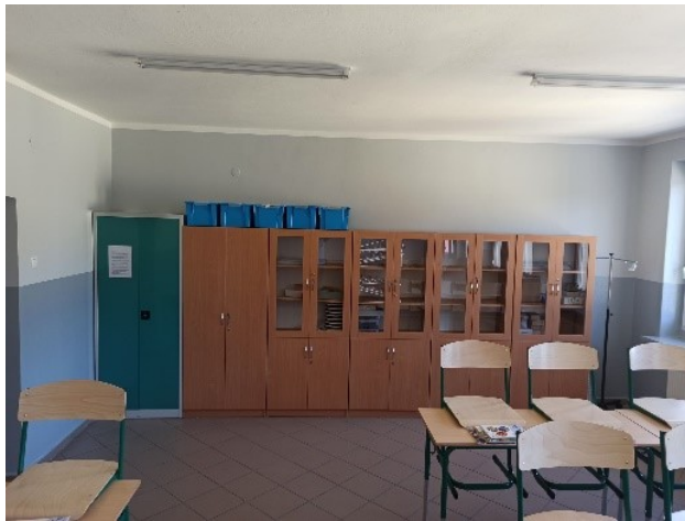
Rysunek 1. Pracownia fizyczno – chemiczna (ekopracownia).