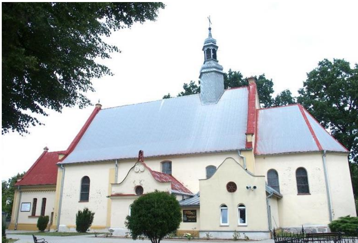
Rysunek 1 Kościół parafialny pw. Wniebowzięcia NMP w Marzeninie źródło: Strategia Rozwoju Gminy Sędziejowice na lata 2021-2026

Przy kościele, w południowo - zachodniej części placu kościelnego znajduje się dzwonnica z XIX w. Wolnostojąca, murowana z cegły, na granitowym cokole. Trójdzielna; trzy słupy (środkowy najwyższy, przepruty wąską arkadą) połączone są parą wąskich arkad z dzwonami podwieszonymi pod archiwoltą. Na licach słupów skrajnych - prostokątne, pionowe płyciny, archiwolty arkad konturowane wąskim profilem. W zwieńczeniu słupów namiotowe daszki, osadzone na profilowanych gzymsach.