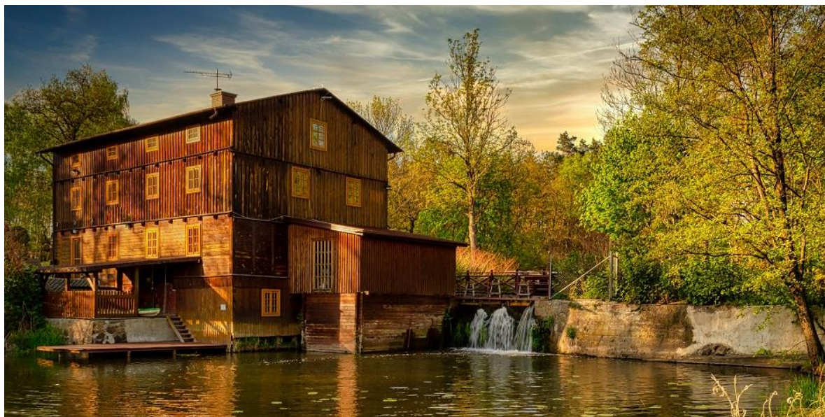
Rysunek 3 Młyn Krzywda w Brzeskach