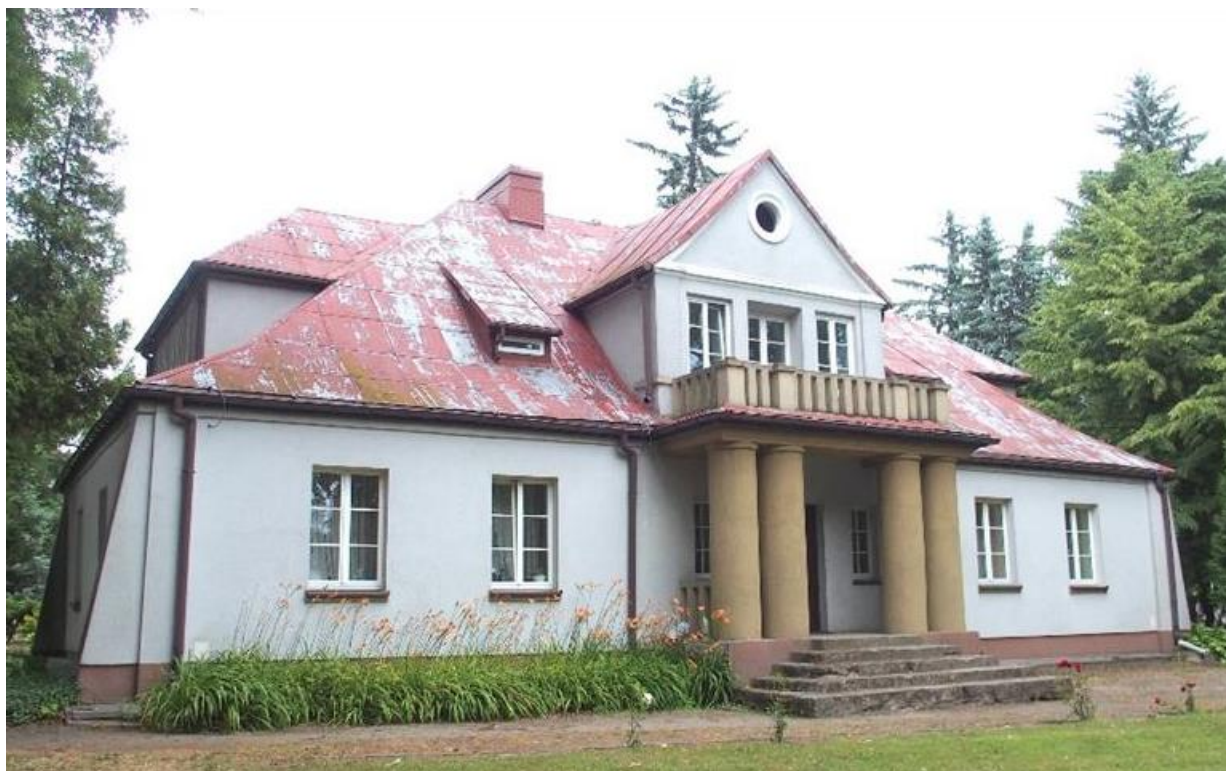
Rysunek 2 Dwór w Sędziejowicach-Kolonii

i Zespołu Szkół Rolniczych. Przy dworze znajduje się dobrze utrzymany park z aleją grabową oraz pomnikowymi dębami.