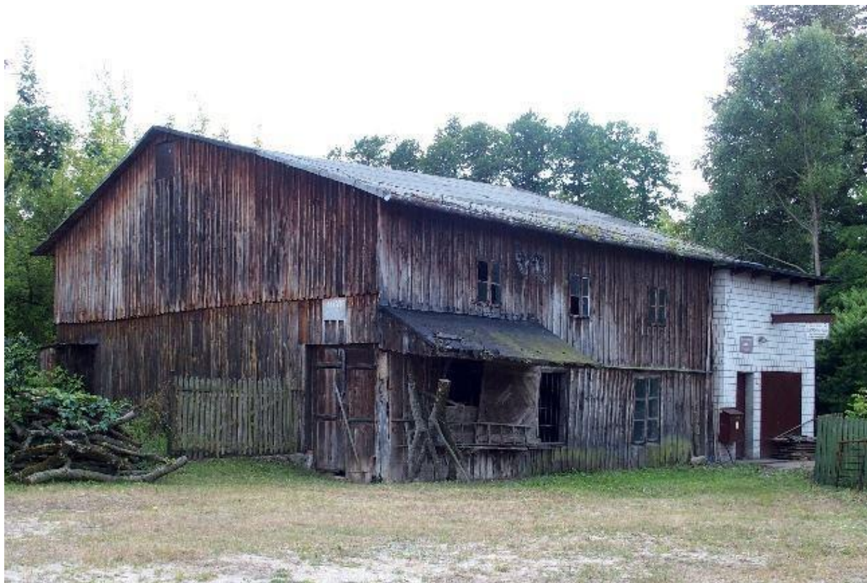
Rysunek 4 Młyn w Nowych Kozubach nr 1