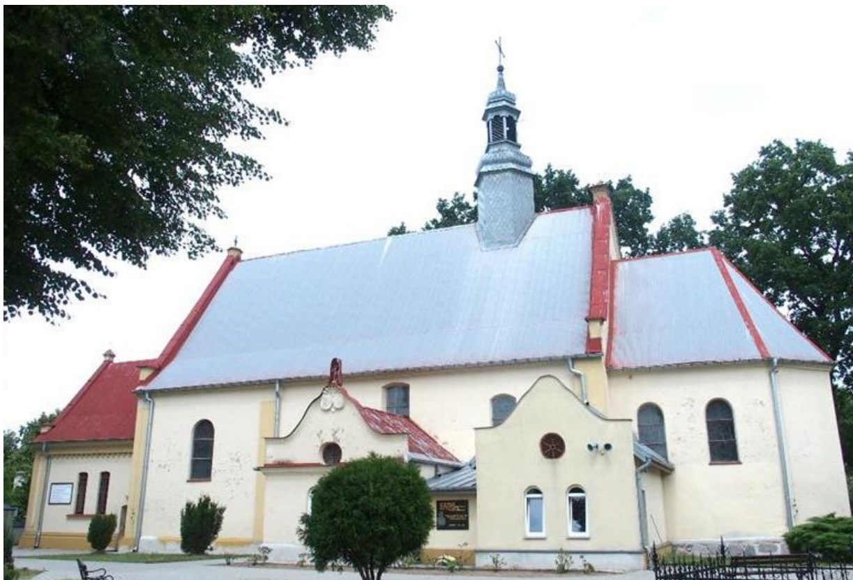
Rysunek 1 Kościół parafialny pw. Wniebowzięcia NMP w Marzeninie źródło: Strategia Rozwoju Gminy Sędziejowice na lata 2021-2026

Dwór w Sędziejowicach - Kolonii – Zespół dworsko - parkowy w Sędziejowicach - Kolonii powstał w 1 połowie XIX w. (około 1840 r.). Sam budynek został przebudowany na początku XX w. Neoklasycystyczny dwór, wzniesiony na planie prostokąta to parterowy, murowany budynek. Od frontu znajduje się ganek z dwiema parami kolumn, na których wsparty jest zbudowany później balkon. Frontowe drzwi zdobią stylizowane promienie słoneczne. Ściany w narożach wzmocnione szkarpami. Niegdyś dwór pokryty był dachówką, którą po remoncie wykonanym w 1978 r. zastąpiono blachą ocynkowaną. Nakryty czterospadowym dachem mansardowym.