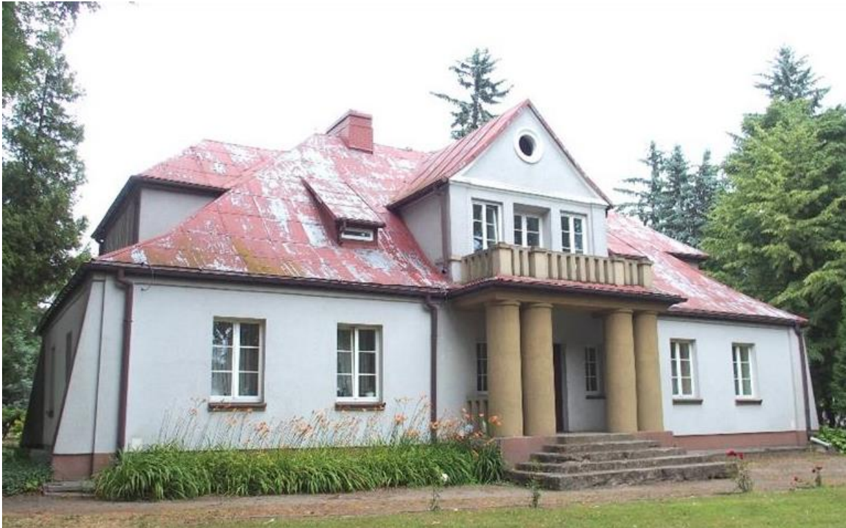
Rysunek 2 Dwór w Sędziejowicach-Kolonii

Ruiny zameczku w Woli Wężykowej – zachowane szczątkowo relikty murów dawnego dworu murowanego, wzniesionego w XVI w., który stanowił gniazdo rodowe Wężyków. Dwór został rozebrany w 1927 r. przez ówczesnych właścicieli.