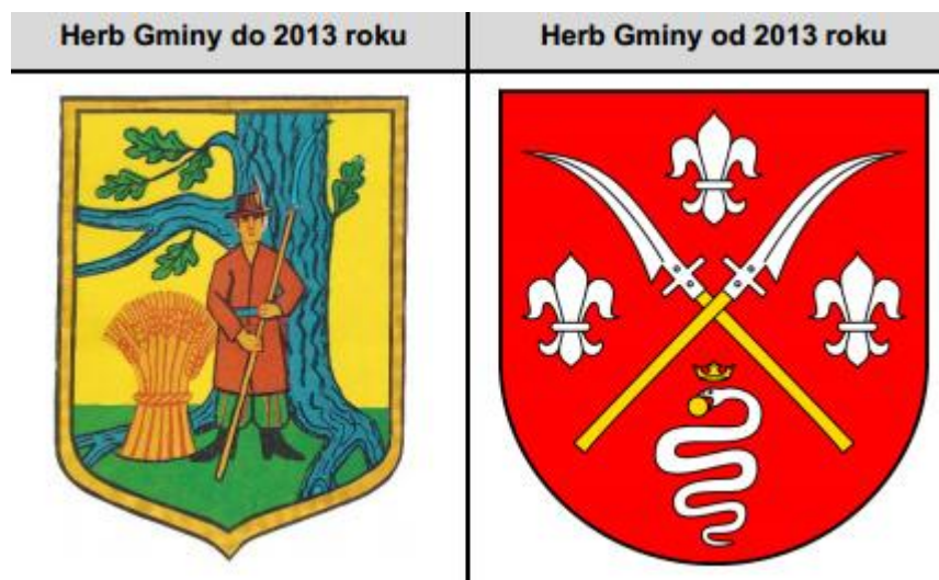
Rys. 1. Herb gminy Sędziejowice