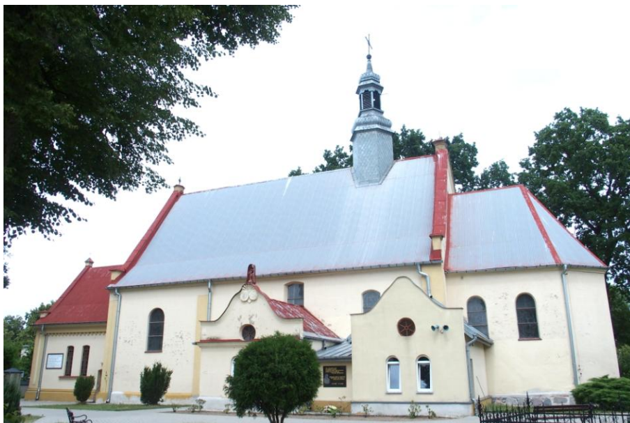
Zdjęcie nr 1. Kościół parafialny pw. Wniebowzięcia NMP w Marzeninie, ul. Łaska 9B

Data erygowania parafii: 1331 r. (abp gnieźnieński Jakub Świnka). Kościół murowany, wybudowany w latach 1370 - 1372, z fundacji arcybiskupów gnieźnieńskich, rozbudowany ok. 1750 r., a następnie w latach 1810 - 1820. Kościół jednonawowy z wielobocznie zamkniętym prezbiterium. Od strony południowej w prezbiterium znajdują się dwa okna z witrażami przedstawiającymi św. Wojciecha i chrzest Polski oraz św. Stanisława i jego męczeństwo. Przy prezbiterium od strony południowej znajduje się nowa zakrystia, która nadała ostateczny kształt bryle kościoła. Przy nawie od strony południowej usytuowana jest kwadratowa kruchta (dawna kaplica) wybudowana w latach 1873 - 1883, a od strony zachodniej duża kruchta, której ostateczny kształt nadała przebudowa w 1896 r. w nawie od strony południowej wykonane są 4 otwory okienne z witrażami przedstawiającymi św. Jana Vianey, św. Tadeusza, św. Jana Bosko i św. Maksymiliana Marie Kolbe, a od strony północnej - dwa z witrażami przedstawiającymi św. Królową Jadwigę i św. Teresę. W kościele zachowały się bardzo cenne polichromie (freski), które są rzadkością w kraju.