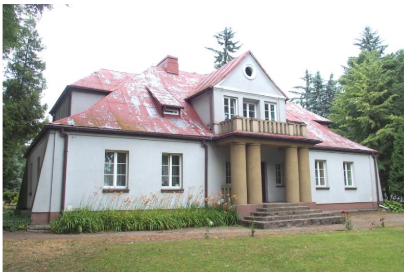
Zdjęcie nr 2. Dwór w Sędziejowicach - Kolonii

Zespół dworsko - parkowy w Sędziejowicach - Kolonii powstał w 1 połowie XIX w. (około 1840 r.). Sam budynek został przebudowany na początku XX w. Neoklasycystyczny dwór, wzniesiony na planie prostokąta to parterowy, murowany budynek. Od frontu znajduje się ganek z dwiema parami kolumn, na których wsparty jest zbudowany później balkon. Frontowe drzwi zdobią stylizowane promienie słoneczne. Ściany w narożach wzmocnione szkarpami. Niegdyś dwór pokryty był dachówką, którą po remoncie wykonanym w 1978 r. zastąpiono blachą ocynkowaną. Nakryty czterospadowym dachem mansardowym.