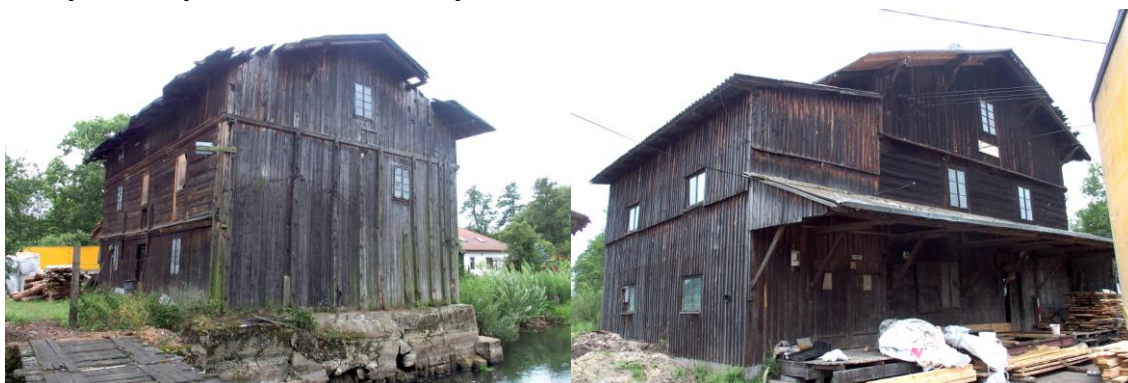
Zdjęcia nr 6, 7. Młyn wodny w Woli Marzeńskiej nr 4

Zabytkowy wodny młyn zbożowy z turbiną sprzed I wojny światowej usytuowany jest na lewym brzegu rzeki Grabi. Ta jednopiętrowa, drewniana w konstrukcji zrębowej, wielokrotnie przebudowywana budowla wzniesiona została w końcu XIX w., o wymiarach 15,3 m x 10,65 m i wysokości 9,09 m. Wybudowany przez rzemieślników i cieśli z drewna sosnowego „bali” o przekroju 0,2 m x 0,2 m.