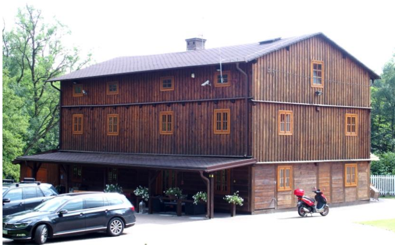
Zdjęcie nr 3. Młyn „Krzywda” w Brzeskach nr 86

Zabytkowy młyn wodny położony nad rzeką Grabią, zbudowany w 1920 r., początkowo był napędzany kołem wodnym, obecnie ma napęd elektryczny. Istnieje możliwość zwiedzania po wcześniejszym umówieniu się z właścicielem Młyn leży na Szlaku Młynów nad Grabią.