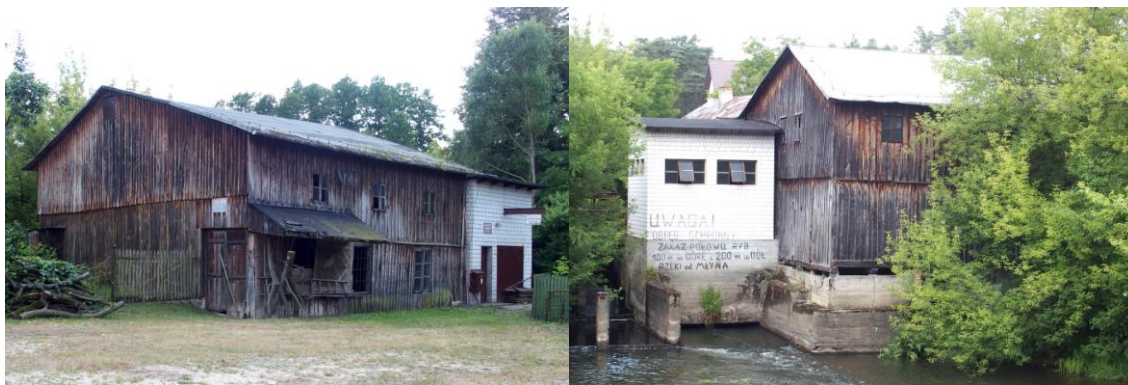
Zdjęcie nr 4, 5. Młyn w Nowych Kozubach nr 1

Młyn pochodzi z 1920 r. Na początku napędzany był, tak jak poprzedni - kołem wodnym. Wyposażony był w dwie pary kamieni młyńskich tzw. „francuskich” oraz perlak, jagielnik i żubrownik. Dziennie mógł przerobić około 1 tony zboża. W latach 30. rozpoczęto jego modernizację - zamontowano wówczas nowocześniejszy napęd czyli turbinę oraz zastąpiono jedną parę kamieni młyńskich metalowymi walcami. Po wojnie młyn krótko pracował - w 1947 r. zlikwidowano kolejną parę kamieni - po czym w latach 1949 - 1956 stał zamknięty. Gdy ponownie go uruchomiono, napędzał go już silnik elektryczny. W 1966 r. młyn przeszedł gruntowny remont i pracuje do dziś. W latach 90. XX w. rozpoczęto odbudowę mocno zniszczonych przez czas i niekonserwowanych od wielu lat urządzeń piętrzących wodę. Ponownie woda zakręciła turbinę w 1992 r.