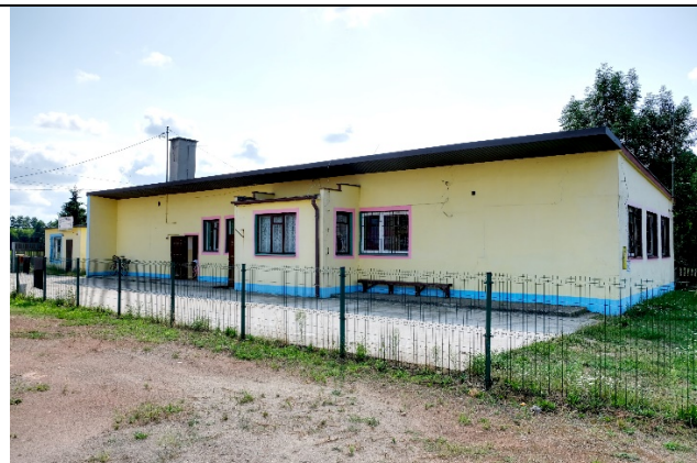
Budynek Publiczne Przedszkole w Sędziejowicach