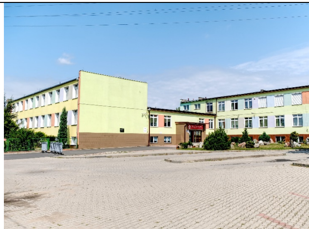
Budynek Zespołu Szkół Ogólnokształcących Nr 1 im. Powstańców 1863 r. w Sędziejowicach

b) Publiczne Przedszkole w Sędziejowicach – 40 dzieci, 2 oddziały.