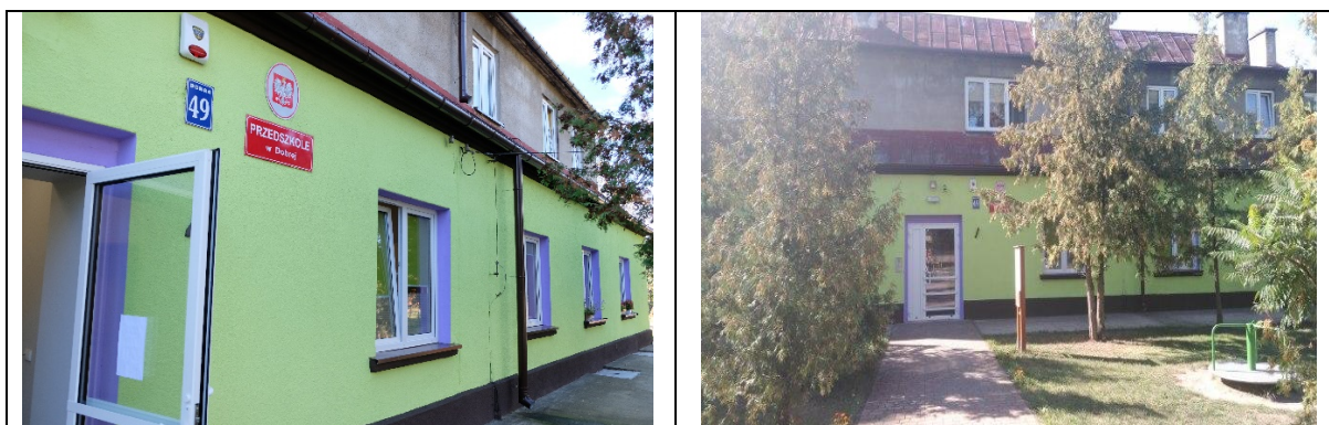
Budynek Przedszkola w Dobrej