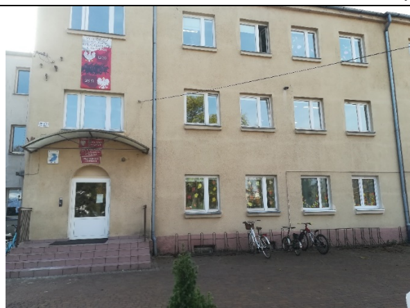
Budynek Zespołu Szkół w Marzeninie

b) Przedszkole w Marzeninie – 50 dzieci, 2 oddziały.